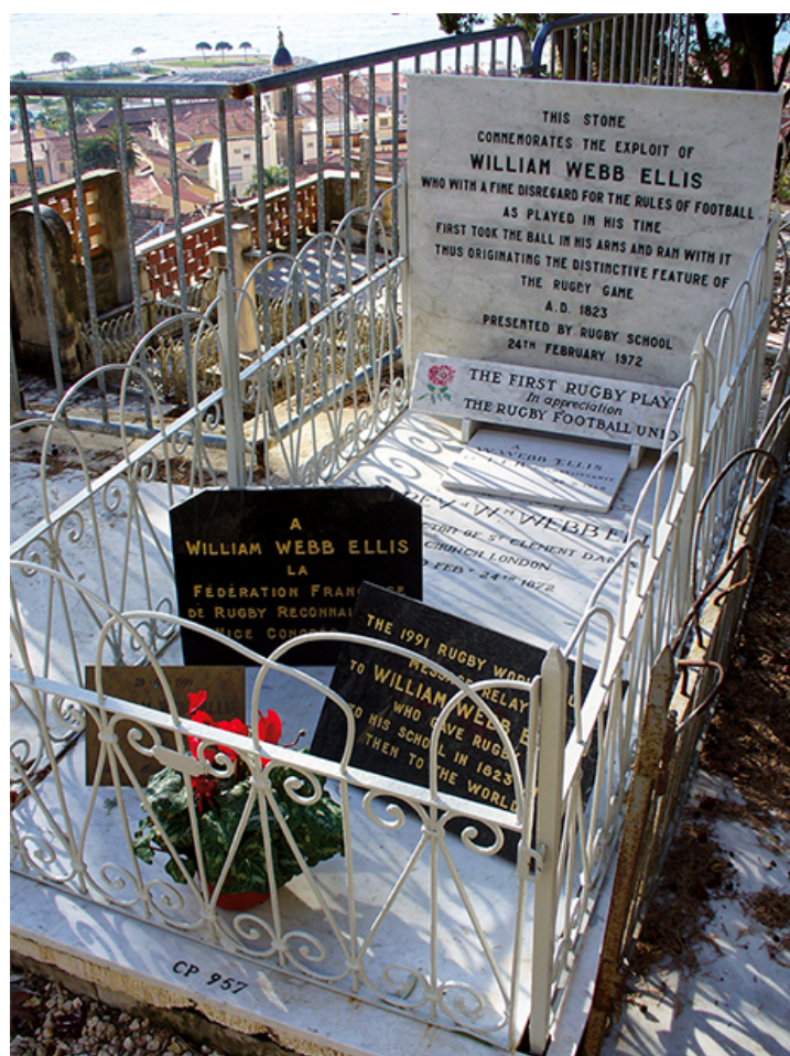
Figure n° 1 : La tombe de William Webb Ellis au cimetière de Menton.

tion est entourée de multiples interrogations. Était-il venu à plusieurs reprises l'hiver pour des séjours avant de s'installer définitivement dans la « perle de la France » comme la désignait le géographe Élisée Reclus ? Nul le sait. Pendant ces années mentonnaises qui sont ses dernières, souffrait-il de la tuberculose ? Aucune certitude là encore même si Menton était connue comme la ville de la Riviera qui permettait d'en guérir plus spécifiquement tant par son climat que par les soins qui y étaient prodigués. À sa mort, le 24 janvier 1872, William Webb Ellis est enterré à Menton dans l'anonymat. Il semblerait qu'il ait lui-même acheté la concession, le caveau 957, ce qui montre une forme d'attachement au lieu. D'ailleurs, nul ne sait quelle était sa résidence à Menton. Peut-être dans une villa, plus vraisemblablement un hôtel avec la piste de la pension d'Italie.