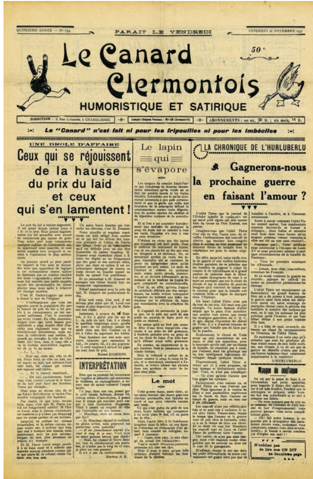
Figure n°2 : La une du Canard clermontois , hebdomadaire humoristique et satirique, consacrée à l'abbé Pistre le 26 novembre 1937.