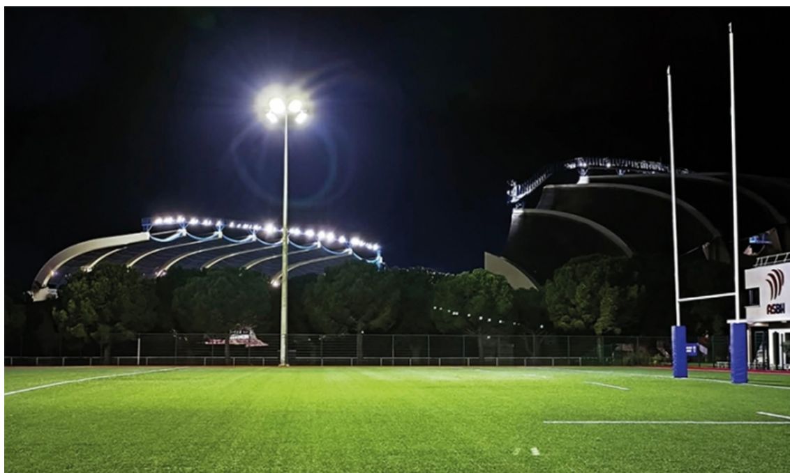
Figure n° 5. Sur la droite de la photographie, le campus, avec le stade Raoul-Barrière en arrière-plan.