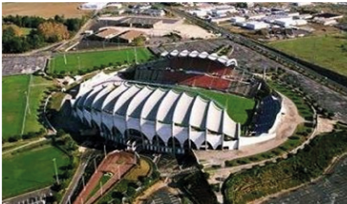
Figure n° 4. Photographie aérienne du stade de la Méditerranée au début des années 1990.