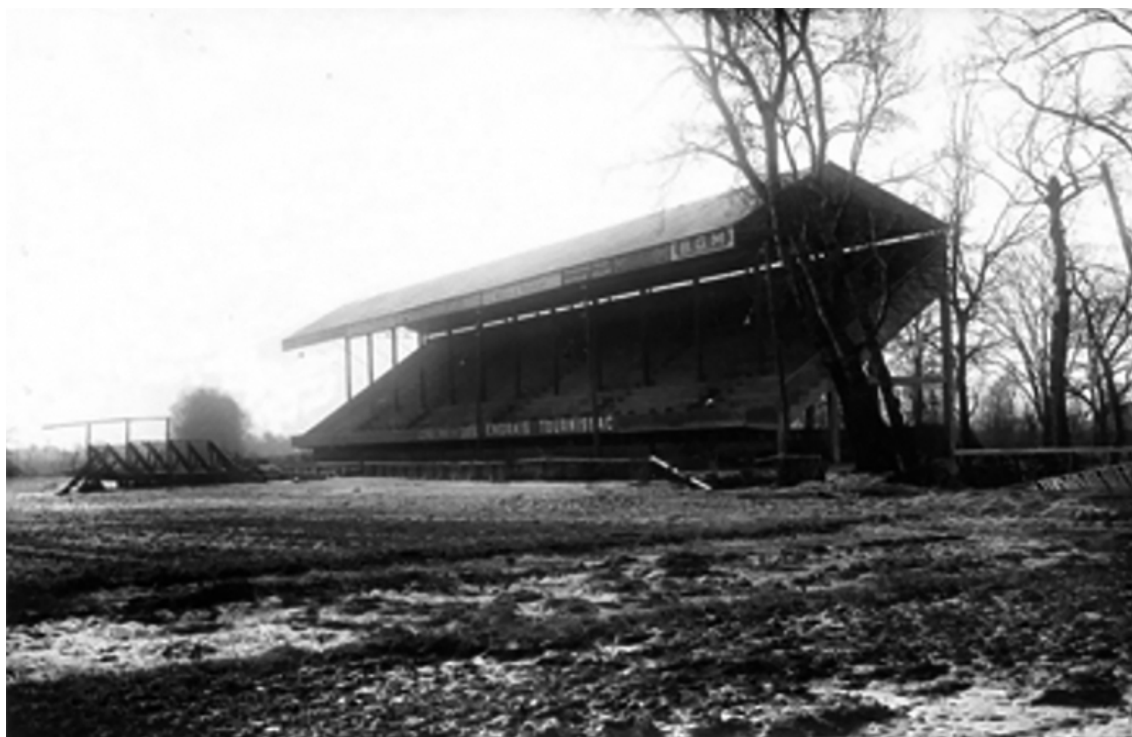
Figure n° 1. Les tribunes en bois du stade de Sauclières dans l'entre-deux-guerres.

ville et à son rayonnement sur le rugby français. Cet article s'interroge sur la place des stades de Béziers dans la construction de l'identité du club, tout en analysant leur rôle dans les dynamiques sociales, architecturales, économiques et sportives qui ont façonné le rugby biterrois.