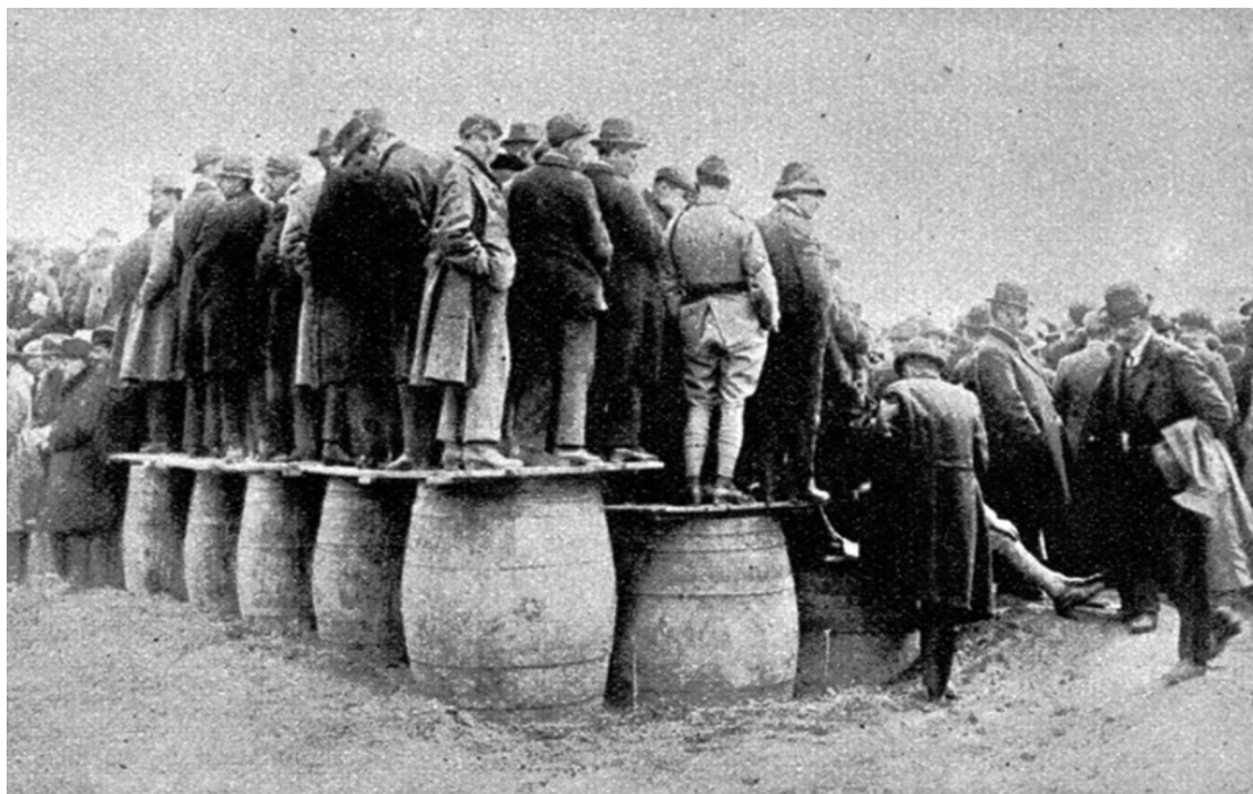
Figure n° 3. Spectateurs assistant à finale du championnat de France de rugby Perpignan-Toulouse disputée au stade de Sauclières le 17 avril 1921.