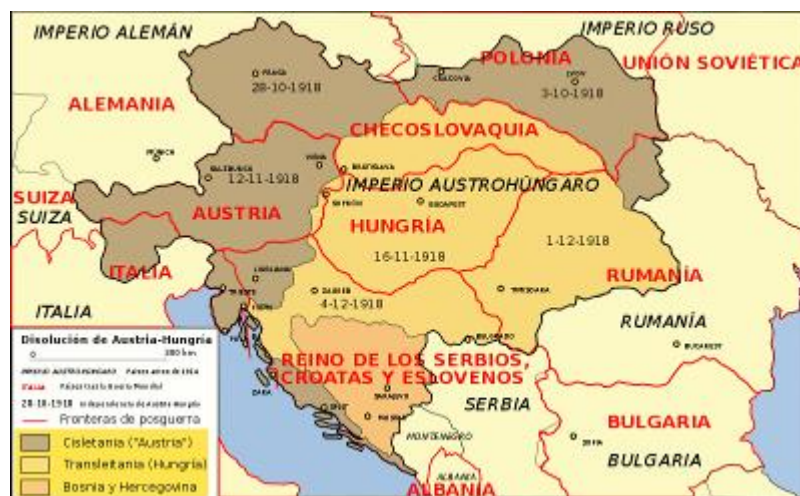
Cuadro 6.- Disolución del Imperio Austro-Húngaro tras la I GM.