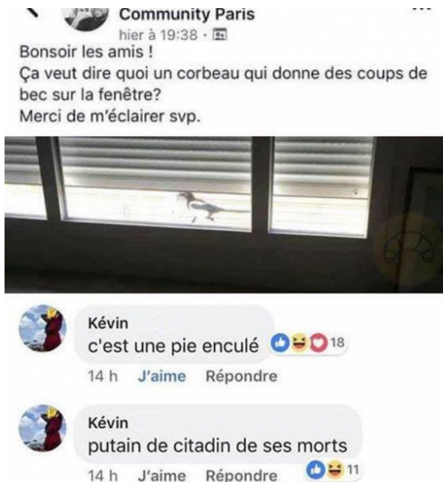
Illustration 1 : capture d'écran à l'origine du groupe « C'est une pie, enculé » sur Facebook, page de couverture, mars 2020