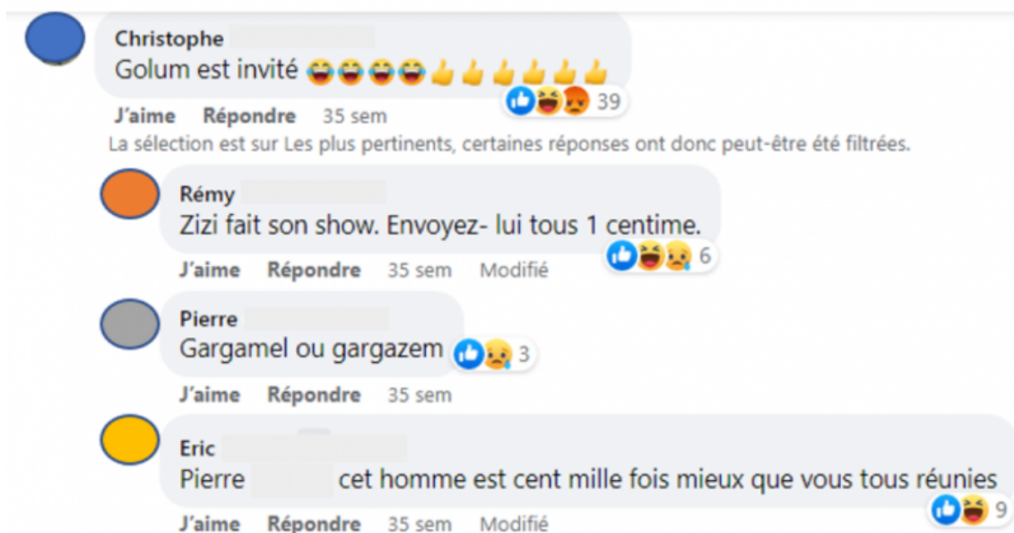
Illustration 2 : Capture d'écran d'un extrait parmi des milliers de commentaires : interview d'E.Z.