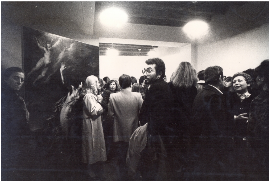
Figure 3. Ansicht der Eröffnungsausstellung der Cooperativa di Via Beato Angelico, 8 April 1976.

Trennseile, Vitrinen oder Vorhänge – brachte die als Inszenierungsvorrichtung dienende Staffelei das Gemälde gleichsam in einen unvollendeten Prozess des Werdens. Die fotografische Dokumentation der Eröffnung zeigt, dass sich die lebensgroße, affektintensivierende Darstellung der Göttin der Morgenröte, die mit gebieterischer Geste die Nacht zurückdrängt und einen neuen Tag einleitet, qua Display buchstäblich unter die versammelte Menge mischte (fig. 3). 37 Zwar lässt sich das doppelte Merkmal der Historizität und Aktualität prinzipiell jedem Kunstwerk der Vergangenheit zuschreiben, dem im Hier und Jetzt begegnet wird. Doch die Präsentationsmodi von Gentileschis Gemälde im Raum der engagierten Kooperative betonten die zeitgenössische Dimension der mythologischen, astronomisch eingebetteter Denkfigur Aurora und ihrer Autorin.